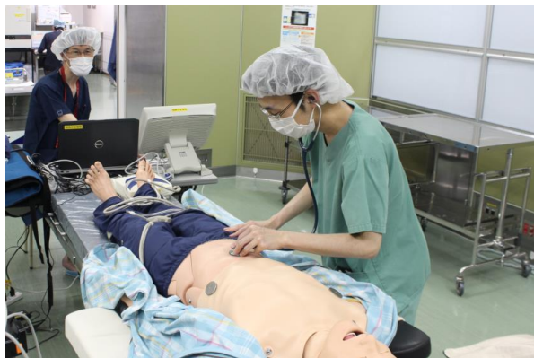
指導医の下でALSシミュレータを用いて救命処置トレーニングを行う様子

医療人としてまだまだ未熟な面が多いと感じておりますが、先生方、外来や病棟の医療スタッフの皆さんに助けをいただきながら、今後も研鑽を積んで参ります。