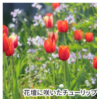
花壇に咲いたチューリップ