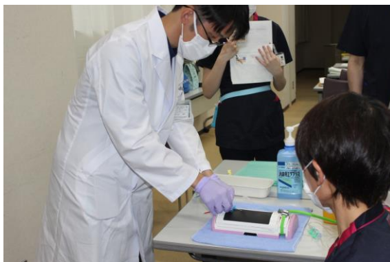
注射・点滴静脈注射の実践 初期臨床研修医も実技に参加