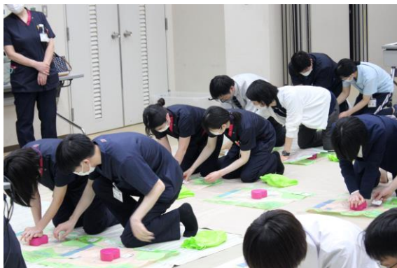
一次救命処置研修 心臓マッサージやAED使用法の研修

現在は、それぞれの職場に配属され、先輩から指導を受けながら業務に励んでいます。新人看護師は名札に初心者マークシールを付けていますので、どうか温かく見守ってください。