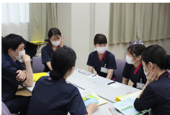
グループワーク 自己紹介をしよう！