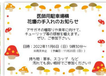
花壇部活動時に有志に配られる案内チラシ