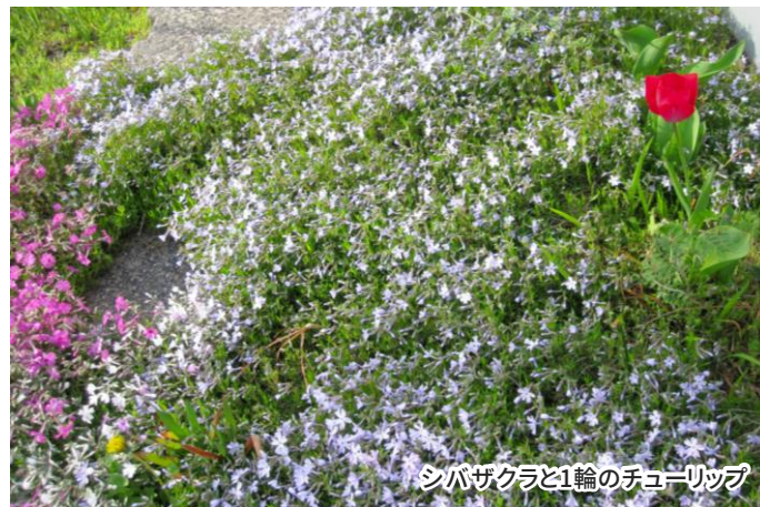
シバザクラと1輪のチューリップ